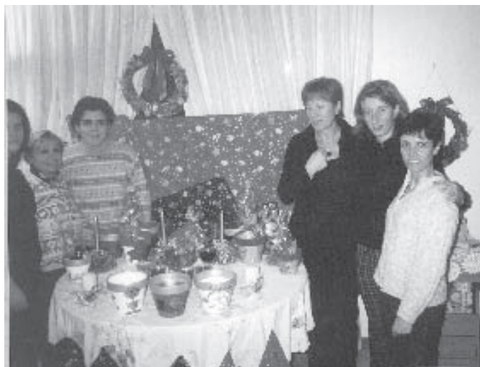
Le socie ed i volontari all'opera

guarda la gente passare piena di regali tornare nella propria casa. Allora se siamo riusciti ad accendere il fiammifero che quella bambina teneva stretto nella mano gelida per riscaldarsi, saremo noi a ringraziarla, perché è Lei che ha dato a noi, il piacere non di riceverlo, ma di fare, un regalo.